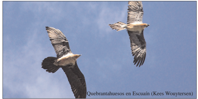
Quebrantahuesos en Escuaín (Kees Wouytersen)

(16) de aves en solitario. Hay dormideros en Valonga y Sariñena y se observó un grupo de 35 y otro el mismo día muy cerca de 16 individuos por lo que podemos estimar la población invernante entre 50 y 100. Hay menos citas del periodo estival y se conoce un caso de nidificación de La Laguna de Sariñena del año 2010. Igual que ha pasado en otros países de Europa occidental podemos esperar que la población siga creciendo.